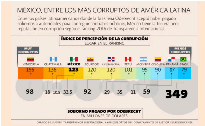
GRÁFICO 1. Índice de percepción de la corrupción en relación