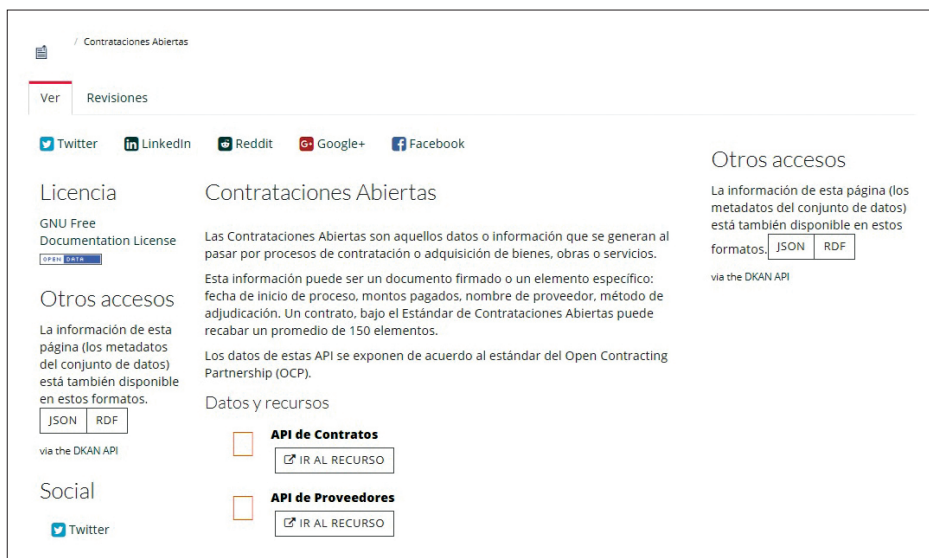
FIGURA 1. Imagen parcial del dataset “Contrataciones Abiertas” perteneciente al portal de Jalisco